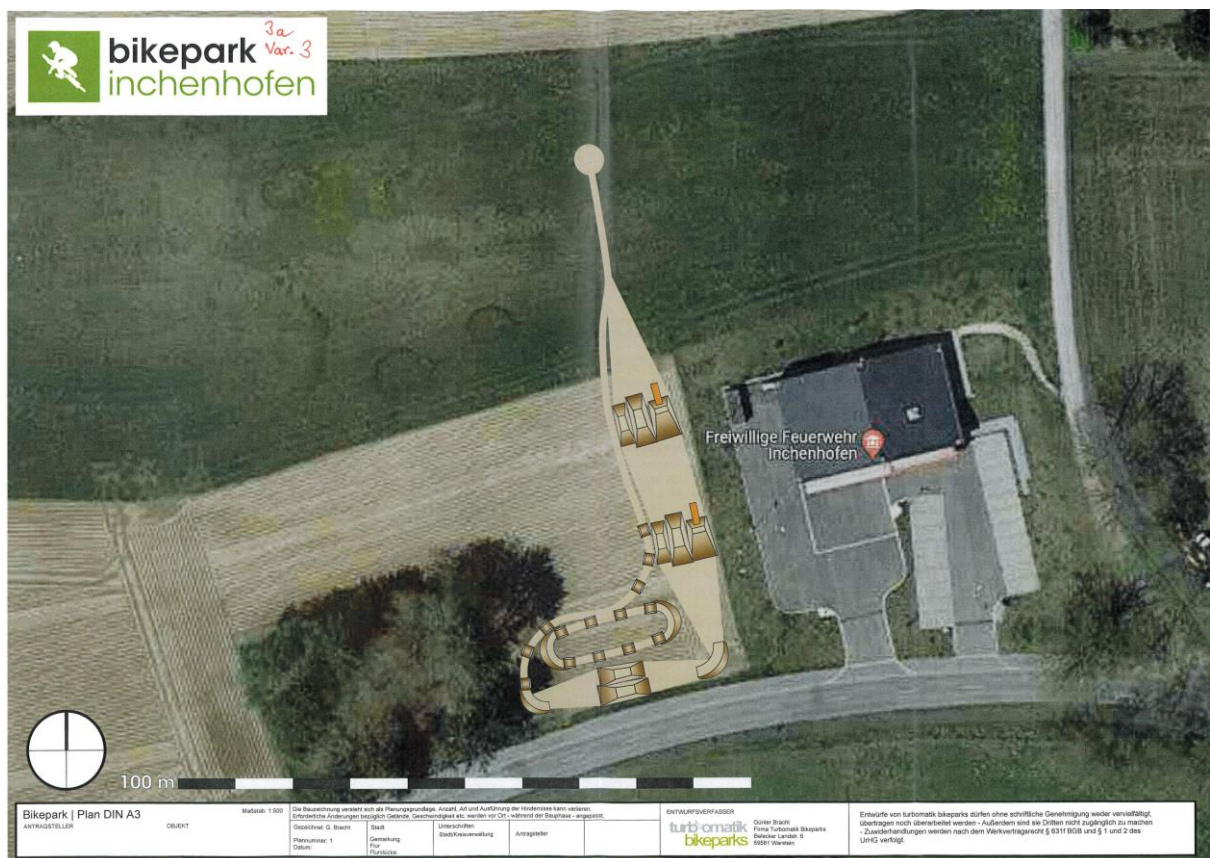
Konzept für die Ausführung des künftigen Dirtparks (Fa. Turbomatik Bikeparks)

Das bestehende, momentan ungenutzte Gebäude des ehemaligen Wasserpumpenhauses (Grundfläche GR ca. 35 m 2 ) auf Fl.-Nr. 461 erhält eine neue Verwendung als Gerätehaus für die Pflege der Grünfläche.