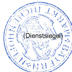
..... Toni Schoder, 1. Bürgermeister